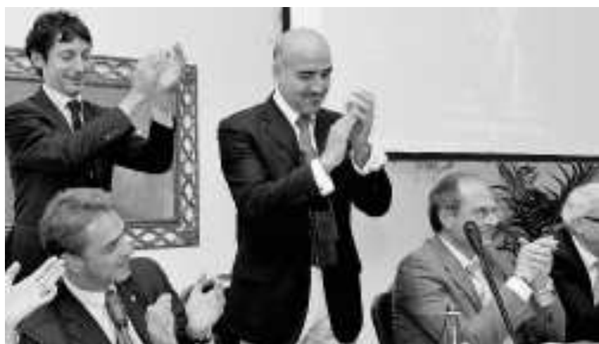
Fabio Spinosa Pingue presidente degli industriali aquilani