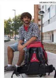
Struttura multietnica. In via Ivrea giovani e famiglie di origini diverse